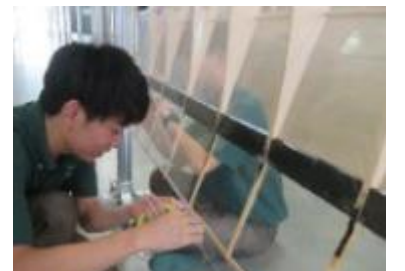
図4 後縁材を取付けた状態